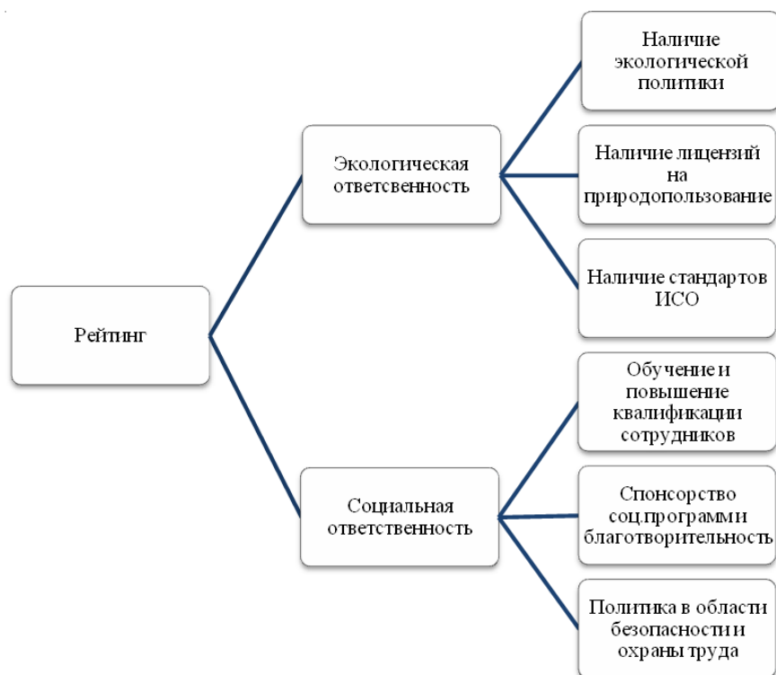
Рисунок 1 - Дерево факторов, веса и составляющие показатели [5]

Рейтинг исследуемых предприятий был составлен из двух групп факторов, объединенных по отдельным показателям: экологическая ответственность и социальная ответственность (рис.1).