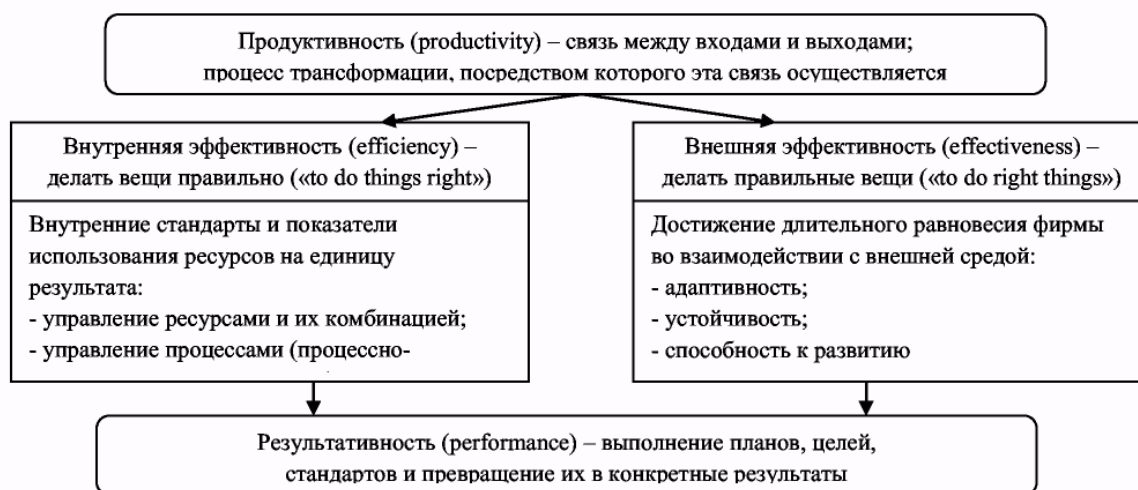
Рисунок 1 - Измерения маркетинговой результативности

Приведем основные понятия, формирующие систему результативности маркетинга: маркетинговая продуктивность (marketing productivity), экономичность маркетинга (efficiency) и эффективность маркетинга (effectiveness), результативность маркетинга (marketing performance).