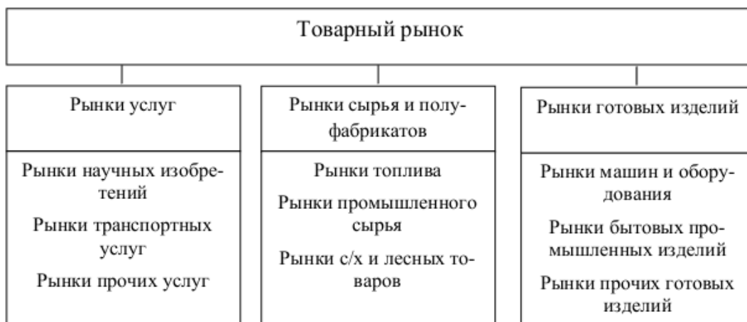
Рисунок 2 – Классификация товарного рынка по товарно-отраслевому признаку

По организационной структуре (рис. 3) выделяют: