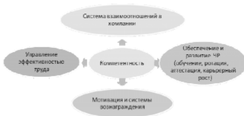
Рисунок 2. Компетентность как фундаментальное понятие, связывающее все элементы подсистемы активизации человеческих ресурсов (составлено авторами)

Структура компетентности, составляющие её элементы являются интегрирующим звеном для всех блоков активизации человеческих ресурсов (рис. 2).