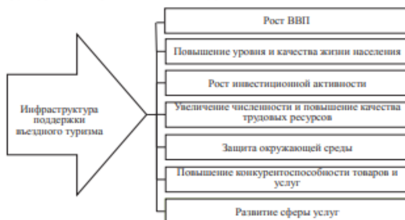
Рисунок 2 – Влияние инфраструктуры поддержки въездного туризма на социально-экономическое развитие Казахстана

В настоящее время в Республике Казахстан инфраструктура поддержки эффективного развития въездного туризма находится в процессе становления и имеет ряд существенных недостатков: неравномерность распределения объектов инфраструктуры поддержки по территории республики; большинство объектов инфраструктуры возникают стихийно, не учитывая потребности субъектов рынка въездного туризма; институты, оказывающие поддержку въездному туризму, сами нуждаются в поддержке со стороны государства; отсутствие многих элементов инфраструктуры; недостаточный по качеству и количеству объем услуг инфраструктуры поддержки; отсутствие систематизированных данных об элементах инфраструктуры поддержки въездного туризма.