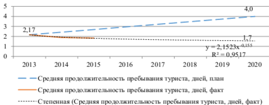
Рисунок 3 – Сравнительный анализ прогнозных значений среднего пребывания туриста в Казахстане

(г.Москва), АТМ (г. Дубай), ITE (г. Гонконг), РАТА Travel Mart-2015 (г. Бангалор), JATA-2015 (г. Токио), WTM (г. Лондон).