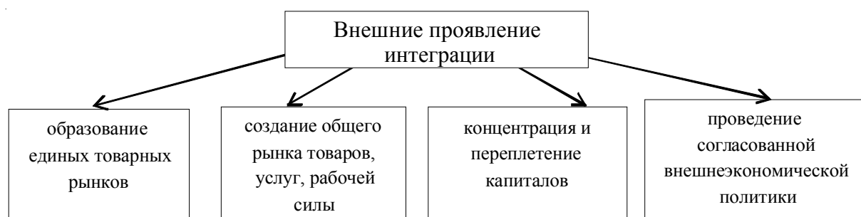
Формы экономической интеграции (с усилением интеграции к концу списка)